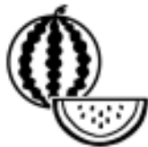
スイカ割りのスイカ あまーい