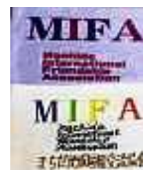
イベント用の MIFA 旗